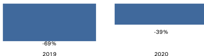
График 1. EBIT-маржа

Финансовые показатели компании. Темпы роста выручки в 2020 году составили 70%. EBIT-маржа составила -69% в 2019 году и -39% в 2020 году. Главные драйверы снижения расходов и роста маржи – снижение расходов на себестоимость с 74% от выручки в 2019 году до 66% в 2020 году, R&D – с 49% до 43% и S&M – с 35% в 2019 году до 21% в 2020 году.