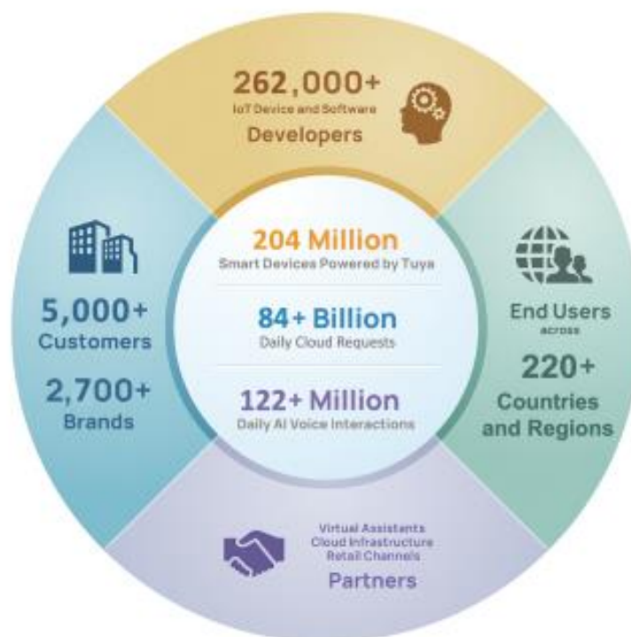
Иллюстрация 1. Экосистема Тuya

Продукт компании и клиентская база. Продукт Тuya позволяет компаниям и разработчикам быстро и экономично разрабатывать, запускать, управлять и монетизировать устройства и услуги с программным обеспечением (продукт позволяет предприятиям легко и безопасно развертывать, подключать и управлять большим количеством и различными типами интеллектуальных устройств).