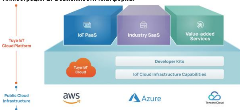
Иллюстрация 2. Возможности платформы

Платформа также имеет возможность переключаться между основными поставщиками облачной инфраструктуры, такими как Amazon Web Services, Microsoft Azure и Tencent Cloud, и интегрирует основные сторонние технологии, такие как Amazon Alexa, Google Assistant и Samsung SmartThings.